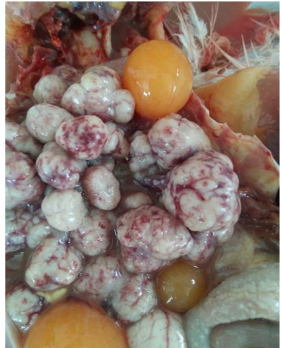
شکل ۱- توموری شدن فولیکول‌های تخمدان