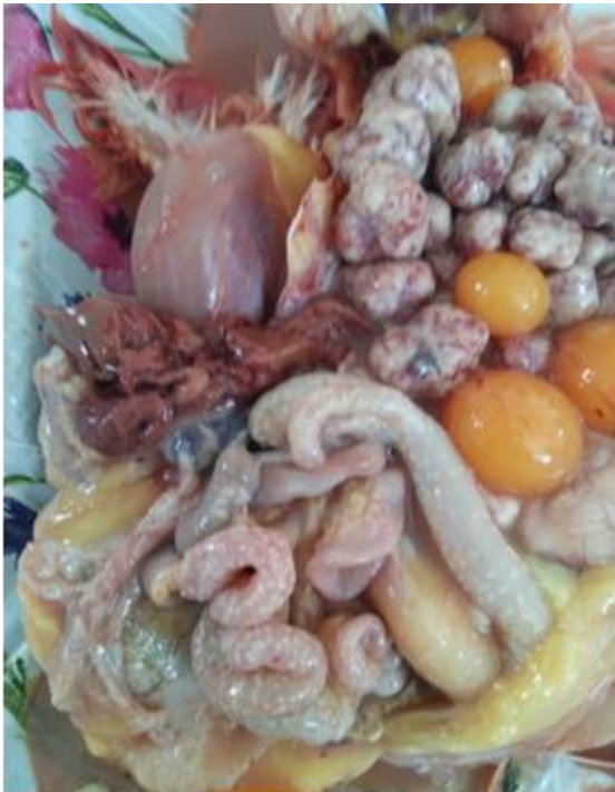
شکل ۲- ندول‌های سفیدخاکستری در سطح سروز

در نهایت بر اساس مشاهدات مربوط به کالبدگشائی، نمونه‌گیری از بافت‌های درگیر به عمل آمده و در فرمالین بافره ۱۰ درصد قرار گرفت و جهت انجام بررسی‌های هیستوپاتولوژیکی به آزمایشگاه بخش پاتولوژی دانشکده دامپزشکی دانشگاه فردوسی مشهد ارسال شد.