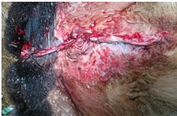
شکل ۳- اصلاح جراحی فتق ناف و هایپوسپدیا و برداشتن بقایای مجرای ادراری