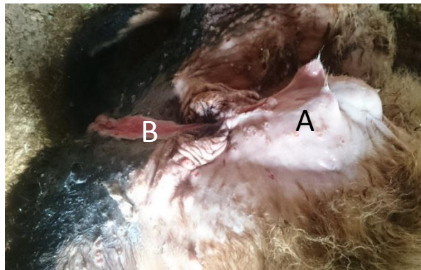
شکل ۱- هایپوسپدیا در یک رأس گوساله دو ماهه. آنومالی درست از ناحیه زیر رکتوم شروع شده و تا نوک آلت قضیب ادامه پیدا کرده و تنها در ناحیه بین بیضه‌ها وجود ندارد. A: فتق ناف، B: هایپوسپدیا، مجرای ادراری