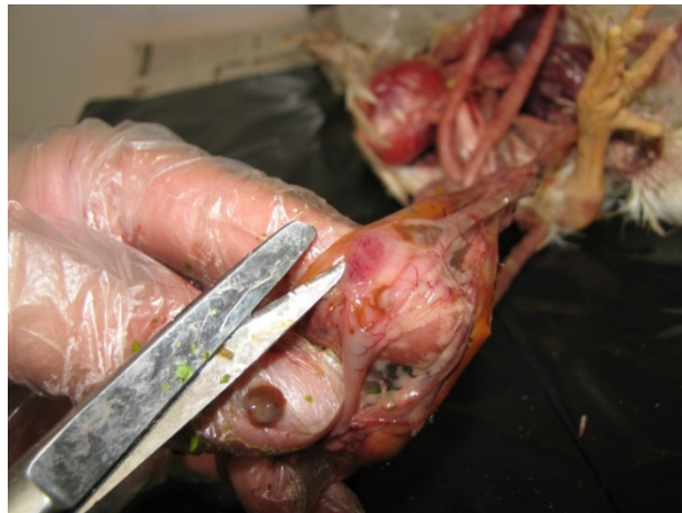
شکل ۳- خون‌ریزی‌های ریز نقطه‌ای در لوزه‌های سکومی در اثر فرم ولوژنیک احشایی