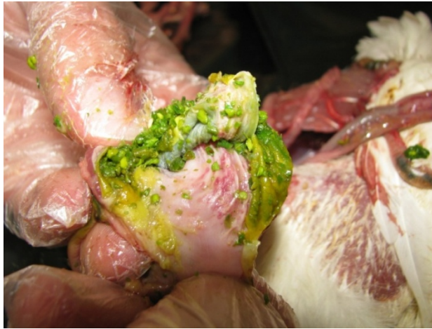
شکل ۲- محتویات سبز رنگ و خون‌ریزی در مخاط سنگدان در اثر فرم ولوژنیک احشایی