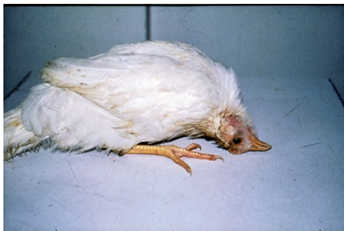
شکل ۴- پیچش گردن در اثر فرم ولوژنیک عصبی