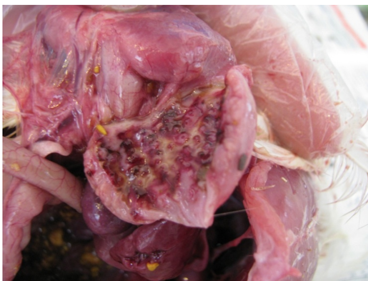
شکل ۱- خونریزی در مخاط پیش معده در اثر فرم ولونژیک احشایی

نهایت در روز ۴۴، تفاوت معنی‌داری بین هر سه گروه مشاهده می‌شد که افزایش تیتراژ گروه دوم نسبت به گروه یک و گروه شاهد معنی‌دار بود. البته در گروه شاهد در این سن عیار مثبتی از نظر آنتی‌بادی علیه بیماری نیوکاسل در آزمایش الیزا وجود نداشت ( p < 0/05 ).