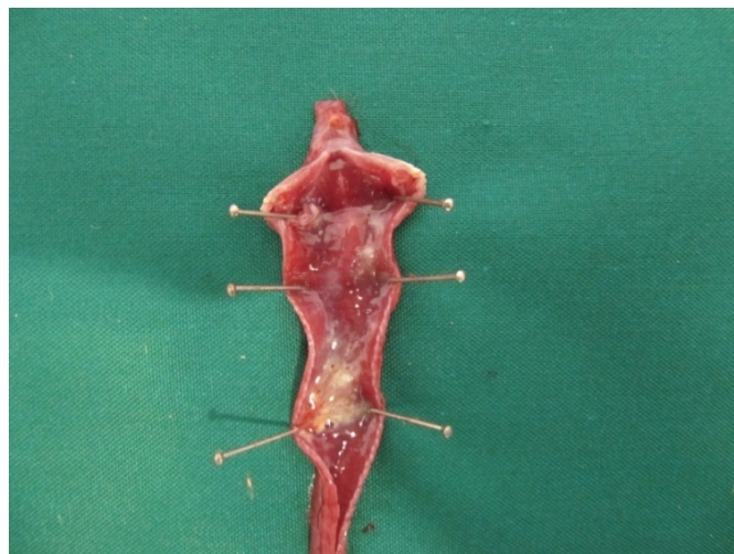
شکل ۶- پرخونی نای به همراه ترشحات در اثر واکنش ناشی از واکسن La Sota

سویه‌های لتوژنیک: بیماری‌زایی کمی داشته و می‌توان سویه‌های B1، F و La Sota را نام برد، سویه‌های مزوژنیک: بیماری‌زایی متوسط دارند، سویه‌های ولوژنیک: بسیار بیماری‌زا می‌باشند. این بیماری انواع زیادی از پرندگان اهلی و وحشی را مبتلا می‌کند. بیماری‌زاترین فرم نیوکاسل (فرم ولوژنیک) معمولاً با دوره‌ی کوتاه و نشانه‌های مشخص