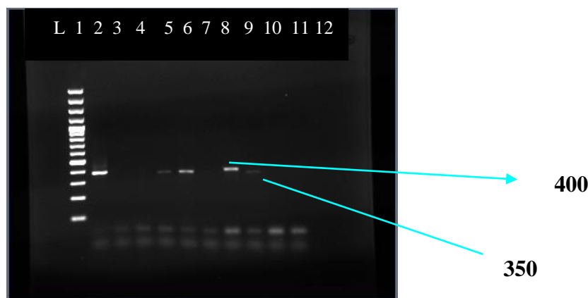
نگاره ۱- محصول PCR ژن VlhA با استفاده از پرایمرهای خارجی MSConsR و MSConsF

از سرد شدن دمای آن به حدود ۵۰ درجه، ۱/۷ لاند اتیدیوم بروماید (ETBr) به آن اضافه شد (این نسبت‌ها برای یک کیت حاوی ژل ۱۵ گودی کافی می‌باشد). سپس محلول با دقت و به آرامی بدون ایجاد حباب هوا در قالب ژل ریخته شد. برای این منظور از حذف کننده حباب‌های هوا (Air bubble remover) استفاده گردید. از تراز سنج جهت یکنواخت پخش شدن ژل در تمام سطوح تانک الکتروفورز استفاده گردید. سپس در ژل و در محل خود قرار داده شد و تا جامد شدن کامل، ژل در دمای اتاق قرار گرفت. پس از آن شانه خارج و ژل در دستگاه الکتروفورز قرار گرفت و محلول ۰.۲٪ TBE تا پوشاندن کامل سطح ژل در تانک ریخته شد. ۱۰ \mu l از محصول PCR با دو میکرولیتر از بافر بارگذاری (Loading buffer) مخلوط (محلول ۱x) و در گوده‌های ژل قرار داده شد. پس از اتمام بارگذاری نمونه‌ها، الکترودها به منبع تغذیه متصل شده، ژل در جریان ثابت ۱۰۰ ولت به مدت ۴۵ دقیقه قرار گرفت. ژل روی دستگاه UV (Bio-RAD, Bio-) قرار گرفته و از آن عکس تهیه شد.